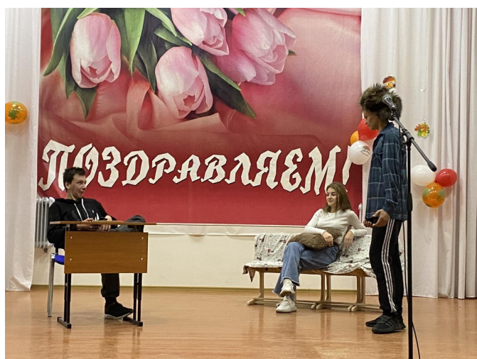
Выступление 9 Б класса с творческим номером «Уборка картофеля»

Также выступили ученики 8 класса со стихотворением «Осень».