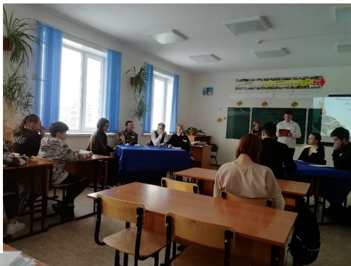
Литературная гостиная «Страницы мятежной жизни М.Ю. Лермонтова» в 8 классе