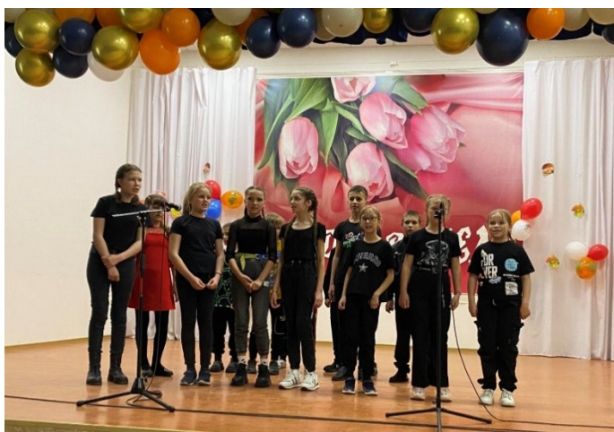
5 класс с песней «Осень золотая»

прекрасными осенними номерами на сцене нашего актового зала. У нас получился настоящий концерт, который мы разбавили разными конкурсами и играми. Всем классам и их классным руководителям объявляется большая благодарность!