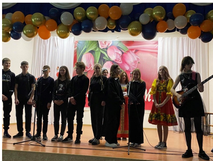
9 А, 10 и 11 класс с песней «Фотографирую закат»